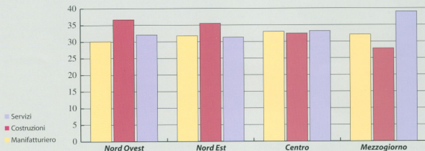
Distribuzione delle Imprese Artigiane registrate per macrosettore e ripartizione geografica (2002)